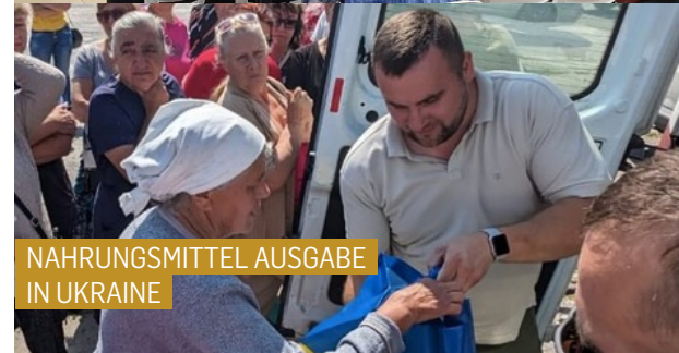
NAHRUNGSMITTEL AUSGABE IN UKRAINE