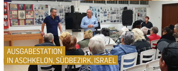
AUSGABESTATION IN ASCHKELON, SÜDBEZIRK, ISRAEL