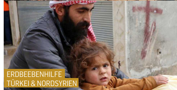
ERDBEEBENHILFE TÜRKEI & NORDSYRIEN